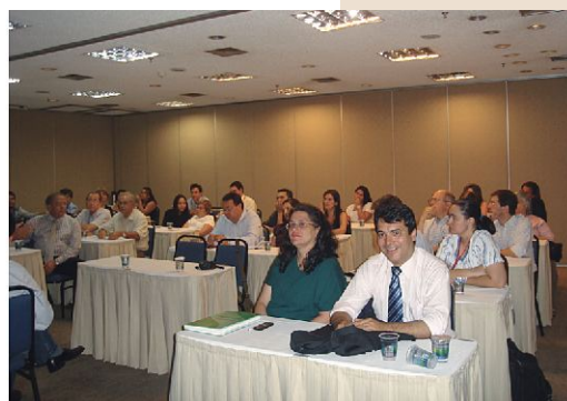
Participantes do workshop