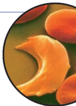
Hemácia com hemoglobina S